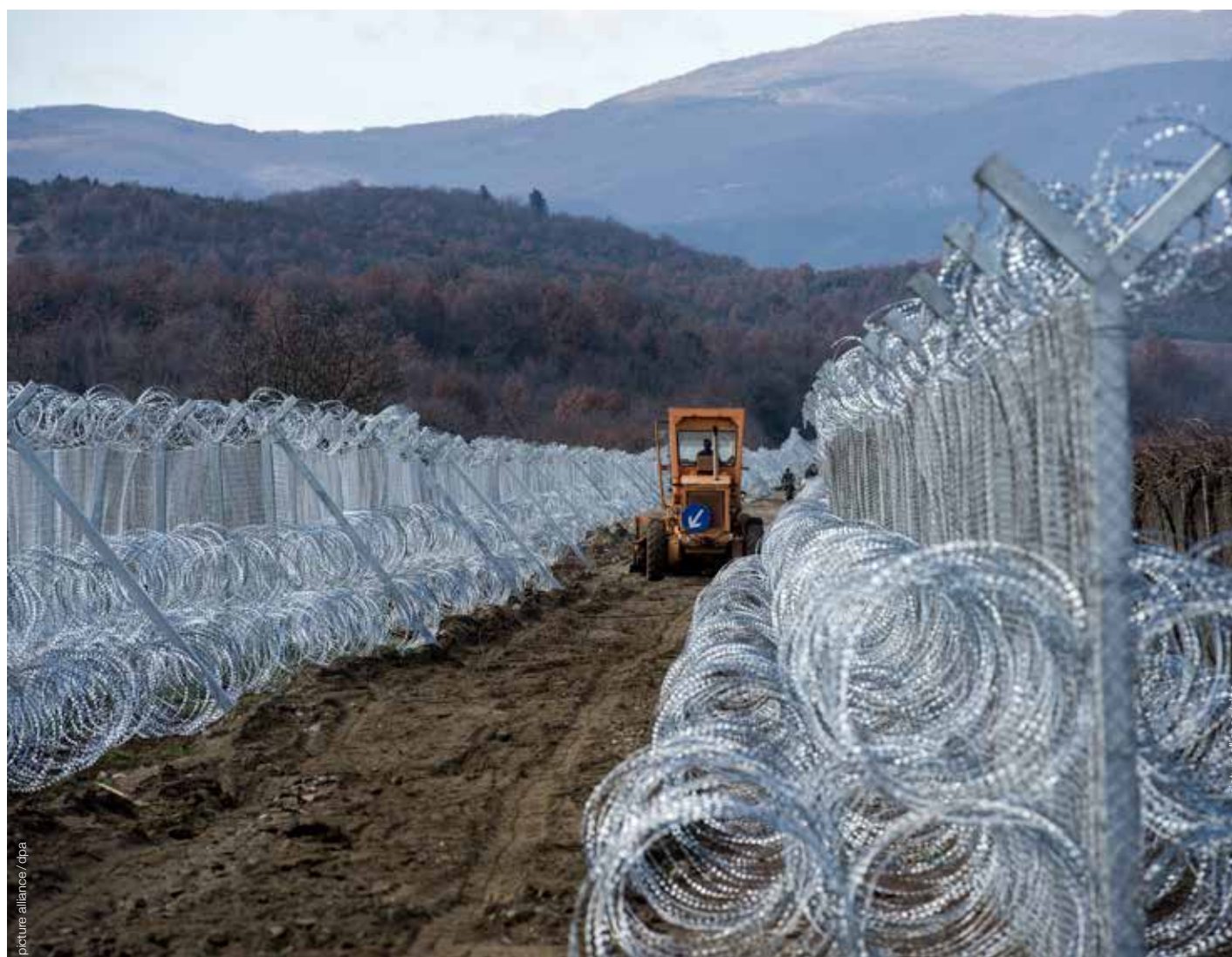
● In Europa entstehen neue Zäune, wie hier an der Grenze zwischen Griechenland und Mazedonien. / New fences such as this one on the border between Greece and Macedonia are being erected.

Nicht überbewerten sollte man die Wiedereinführung von Grenzkontrollen im Schengenraum nach Ansicht der christlichen Salzburger Nachrichten: „Grenzkontrollen sind in