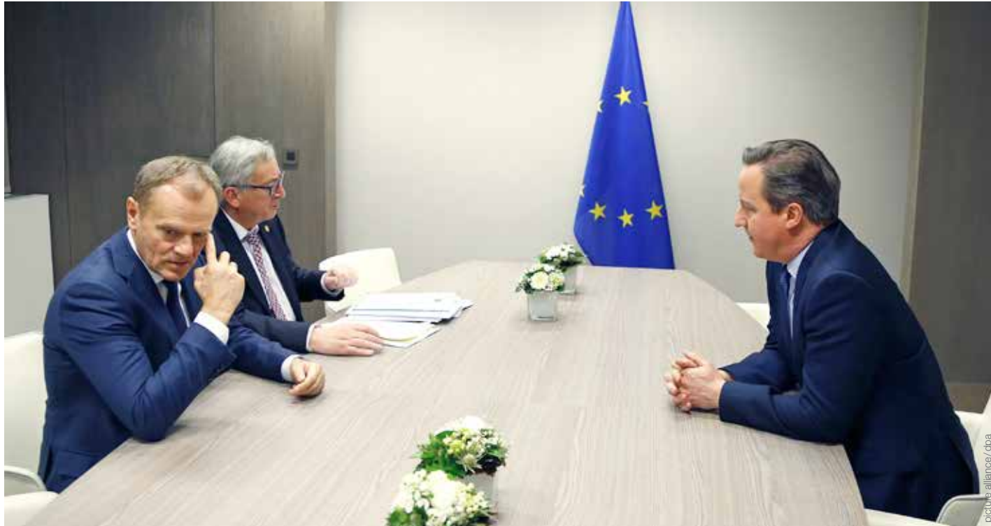
● Tusk, Juncker und Cameron verhandelten im Februar in Brüssel über ein Reformpaket für Großbritannien. / Tusk, Juncker and Cameron negotiated a reform package for Britain in February.