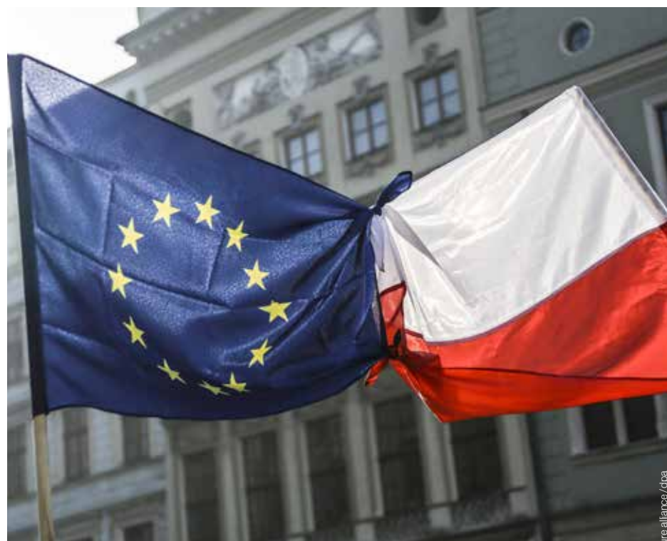
● Erstmals leitete die EU ein Verfahren gegen einen Mitgliedstaat ein, weil er im Verdacht steht, Grundwerte der Union zu missachten. / For the first time the EU has initiated proceedings against a member state suspected of disregarding the Union's fundamental values.

Die Mahnungen aus Brüssel sind nur ein Zeichen dafür, dass die EU um ihren Einfluss in Polen fürchtet, glaubt die national-katholische Tageszeitung Nasz Dziennik: „Die Führungsriege der PiS befindet sich doch gerade erst am Anfang ihrer Arbeit. ... Die panischen Stimmen aus dem Wes-